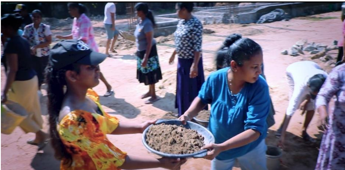
De parochiegemeenschap van Vishakawatta (Sri Lanka) is zo gedreven dat ze zelf op vrijwillige basis letterlijk hun nieuwe kerk bouwen. Voor het materiaal vragen ze onze hulp.

Vandaag is het feest van de heilige Engelbewaarders. Jezus zegt over de kinderen dat "zij engelen hebben in de hemel die steeds het aangezicht van mijn hemelse Vader aanschouwen" (Mt 18,10). De essentie van de engelen is om op God gericht te zijn. De missie van de engelen ten opzichte van ons is om ons op God te oriënteren. Onze gedachten moeten gericht zijn op het hemelse, niet op het aardse. Onze blik moet gericht zijn op het doel, op God, zodat ons leven niet verloren gaat in de meanderende lijnen van vanzelfsprekendheden.