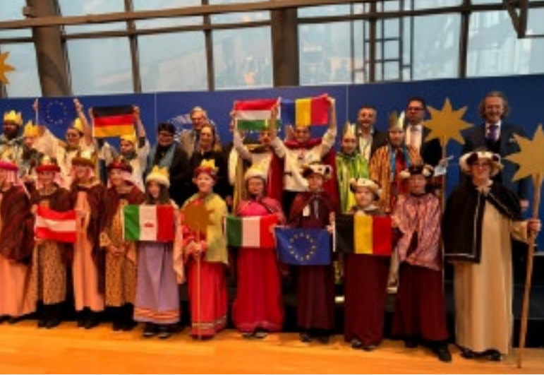
Accueil au Parlement européen à Bruxelles

effectivement affiché à de nombreux endroits) voire plusieurs années, s'ils ne recouvrent pas celui de l'année précédente.