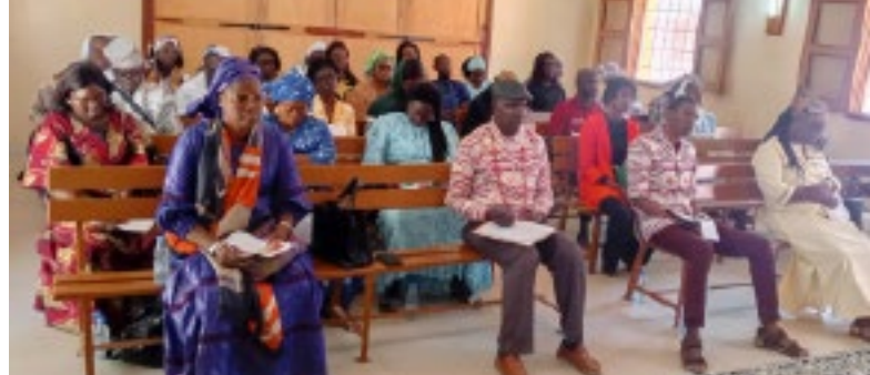
Formation des catéchistes dans le diocèse de Saint-Louis