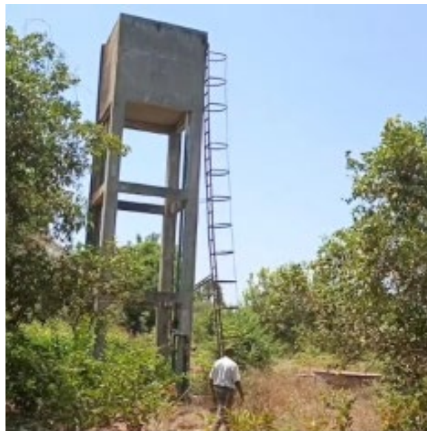
Le château d'eau sur le terrain du Grand Séminaire

Pour remédier à cette situation, le séminaire souhaite imperméabiliser le toit et réparer les murs