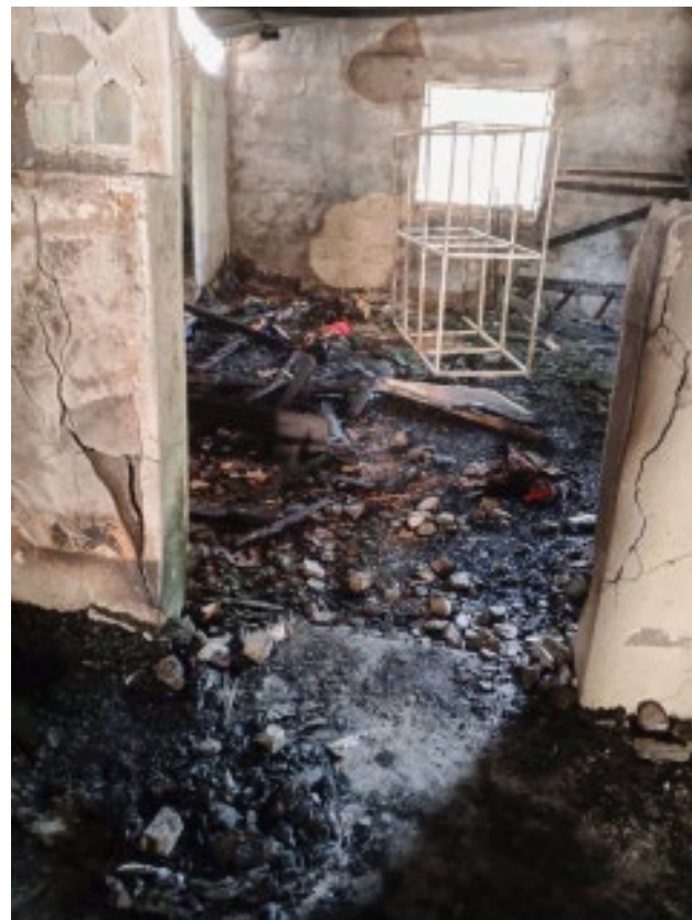
Le foyer d'accueil après l'incendie dévastateur

Ensemble, nous pouvons faire la différence.