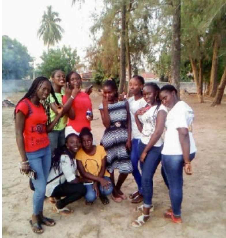
Quelques jeunes filles ayant séjourné au foyer d'accueil

En février 2024, la maison a été entièrement détruite par un incendie. Heureusement, les filles étaient à l'école et il n'y a eu aucune victime. Grâce à la solidarité locale, elles ont pu être hébergées temporairement dans des familles d'accueil, mais