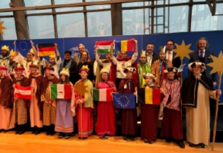
Ontvangst in het Europese parlement in Brussel

torale eenheid met 2 of 3 bijeenkomsten met de kinderen. Het initiatief wordt uitgelegd, de campagnefilm wordt samen bekeken om zo voorbereid te zijn voor het eropuit trekken. Op de dag zelf beginnen we 's morgens met een zendingsviering in de parochiekerken. Dit is een woorddienst waarbij alle groepjes van de pastorale eenheid en hun begeleiders aanwezig zijn. In Bütgenbach gaat het over 110 kinderen, in onze buurgemeente Amel zelfs 200. De verklede zangers nemen het materiaal mee en gaan op stap, samen met de begeleiding. Als de deur opengaat, zingen ze een lied en brengen ze de huiszegen '20°C+M+B+26' aan, vroeger met krijt, nu met een sticker. Deze blijft minstens een jaar lang hangen ( als je in de Oostkantons rondwandelt, zie je deze inderdaad op vele plaatsen hangen, n.d.r. ) of zelfs jaren, als ze deze van het vorige jaar niet overplakken.