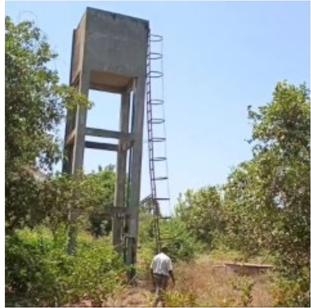
Watertoren op het terrein van het Grootseminarie

Om deze situatie aan te pakken wil het seminarie het dak waterdicht maken en de beschadigde