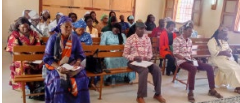
Catechistenvorming in het bisdom Saint-Louis

In het aartsbisdom Dakar worden meer dan 2.000 catechisten gevormd over pedagogische, liturgische, bijbelse en theologische thema's en zelfzorg. Daarna wordt de permanente vorming verder-