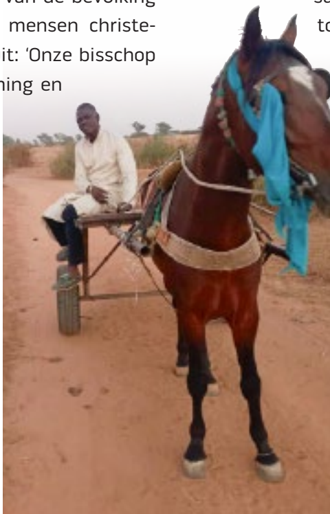
Een catechist onderweg naar een catechesemoment in het bisdom Thies

Ook in het bisdom Ziguinchor worden vele taken aan catechisten toevertrouwd. 'Hun belangrijkste taak is het lesgeven aan kinderen en volwassenen volgens het nationale draaiboek', zo lezen we in een rapport dat ons is toegezonden. 'Zij werken samen met de priesters in pastorale zorg. Hiervoor is natuurlijk vorming nodig. De parochie brengt de catechisten samen en ze worden door pastores begeleid. Vervolgens is het dekenaat de plek voor uitwisseling van ervaringen en verdere vorming. De diocesane commissie organiseert ook elk jaar een vormingsweekend in elk dekenaat en een opleidingsmoment voor alle catechisten in het bisdom.'