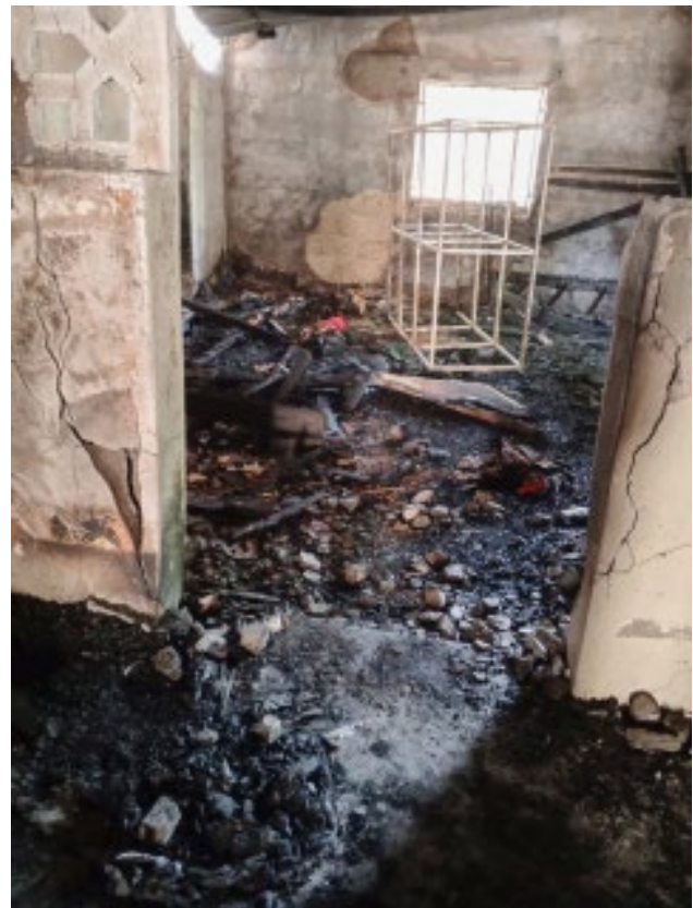
Opvangtehuis na de verwoestende brand